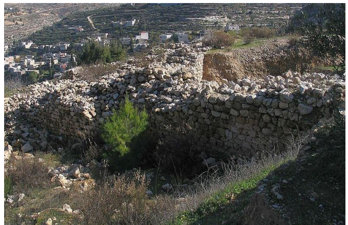
חרבת אל יהוד - ביתר של בר כוכבא

נחמיה איש תקוע הביא חלות מבית תור ולא קיבלו ממנו (חלה פ"ד מ"י)