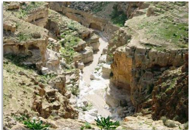
נחל דרגה (ואדי מורבעת)