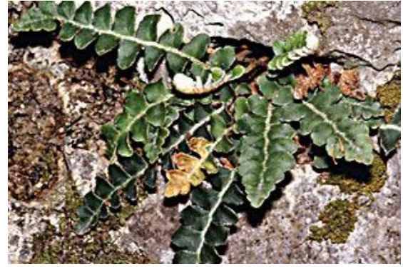
דנדנה רפואית

המסורת המקובלת בקרב הפרשנים האחרים (ובראשם הרמב"ם, שביטתו נדון בעז"ה בהמשך) מזהה את הדנדנה כמין של נענע. הבעיה בכך היא שעל פי דברינו, 'עיקר הדנדנה' הנזכר במשנה ב אמור להיות ראוי למאכל, ואילו שורש הנענע אינו נאכל. לכן מזהה אותו פליקס עם צמח אחר ששמו דנדנה רפואית ( Asplenium ceterach , או בשם נרדף: Ceterach officinarum ). צמח זה הוא מין שרך (שרך הוא צמח נטול פרחים זרעים, שמתרבה באמצעות נבגים הנמצאים מתחת לעלה).