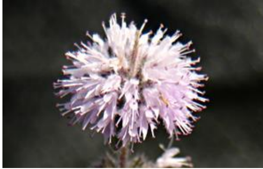
נענת הכדורים

לפי זה עיקר הלוף השוטה אינו ראוי למאכל גם אחרי שיתמתק. לפי הרמב"ם גם אין בעיה לזהות את הדנדנה כנענע, כפי שהוא אכן מזהה אותה כך בפירושו. שורש הנענע אינו נאכל, והדבר מתאים מאוד לגרסתו במשנתנו. ובקשר למיני הצובעין שנזכרו במשנה ב, הרמב"ם בפירושו המשנה מסביר כי הם אינם חלק מהכלל המופיע בראש משנה ב. לשיטתו מדובר על מיני צובעין שכן מתקיימים בארץ, ולכן אין להם ביעור.