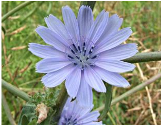
עולש מצוי

המסורת המקובלת בקרב הפרשנים האחרים (ובראשם הרמב"ם, שביטתו נדון בעז"ה בהמשך) מזהה את הדנדנה כמין של נענע. הבעיה בכך היא שעל פי דברינו, 'עיקר הדנדנה' הנזכר במשנה ב אמור להיות ראוי למאכל, ואילו שורש הנענע אינו נאכל. לכן מזהה אותו פליקס עם צמח אחר ששמו דנדנה רפואית ( Asplenium ceterach , או בשם נרדף: Ceterach officinarum ). צמח זה הוא מין שרך (שרך הוא צמח נטול פרחים זרעים, שמתרבה באמצעות נבגים הנמצאים מתחת לעלה).