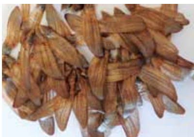
זרעי אורן ירושלים

הצעות נוספות: עם זאת, ייתכן שבנות שוח הן אכן זן חריג של תאנים שאיננו מכירים כמותו היום שזמן הבשלתן עמד על שלוש שנים 8 . העובדה שלוקח להן שלוש שנים מקשה גם על זיהויים נוספים שהעלו אחדים מן המפרשים לבנות שוח: חרובים ובננה.