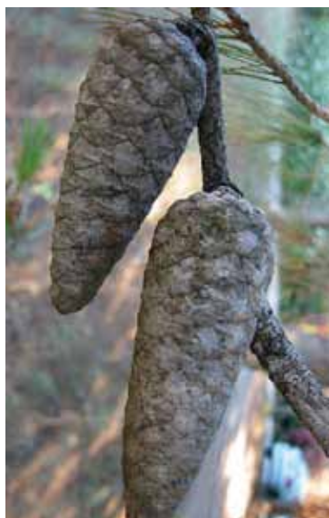
איצטרובל של אורן ירושלים

'בנות שוח שביעית שלהן שניה שהן עושות לשלוש שנים' (שביעית ה א).