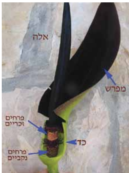
חלקיו של הלוף

השזרה מין ענבות אדומות, שבכל אחת יש זרעים אחדים 12 . ריבוי הלוף: ריבוי הלוף נעשה בשני אופנים: (א) ריבוי אל מיני - מתאפשר על ידי פקעות ריבוי קטנות שנוצרות סביב פקעת האם, ובאביב, כשהפקעת מצטמקת, הן נושרות, ואפשר לשתול אותן כך שיצמחו לפקעות עצמאיות. תהליך זה מסביר את המשנה במסכת תרומות המונה את הלוף עם הדברים שאין זרעם כלה, כלומר, שתילת הפקעת אינה גורמת לכך שהיא מתכלה (כמו שקורה למשל בזרעי חיטה ושעורה) אלא היא נשארת קיימת בקרקע וממשיכה להתפתח בה. (ב) ריבוי מיני - על ידי זרעים. הזרע הופך לפקעת שגדלה לאט יחסית, ובצמח החדש נוצרים זרעים לאחר שלוש שנים. לאור זאת, אפשר להבין את דברי המשנה במסכת כלאים שאסור