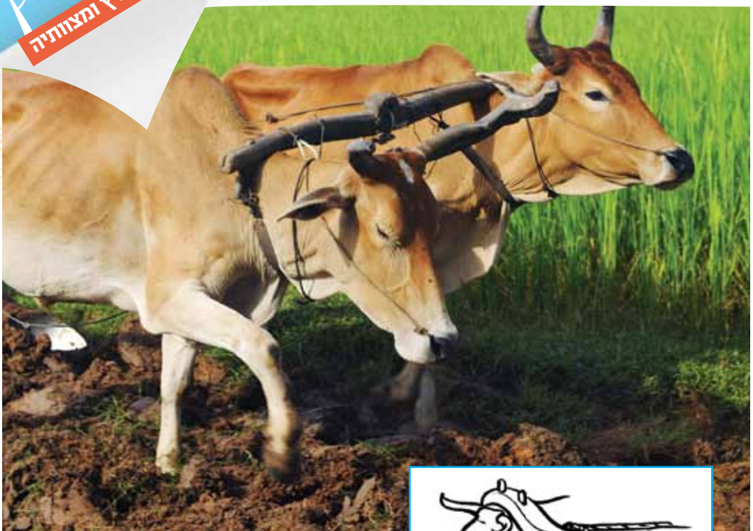
עול רגיל - צמד (עול השרוני, לעומתו, הוא עול של בהמה אחת)